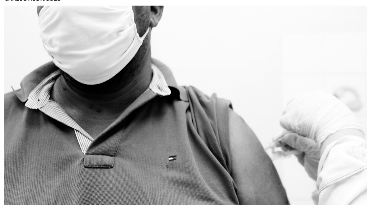
> Serão oferecidos serviços de avaliação nutricional e vacinas contra a gripe

Oeste, Vila Ipiranga, Vila Nova) e sete na área urbana (Centro, Coopagro, Europa, Industrial, Maracanã e São Francisco, além da Paulista, onde só gestantes e puérperas estão sendo atendidas).