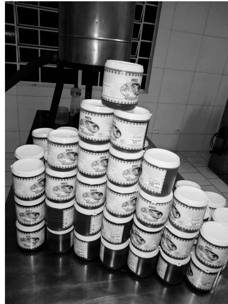
> Após pronto, o mel é comercializado em Toledo

roçadas são realizadas ao redor das caixas. Também é o momento para a troca de cera ou para retirar o própolis em excesso. Além disso, o apicultor pode realizar a alimentação de estímulo para as abelhas".