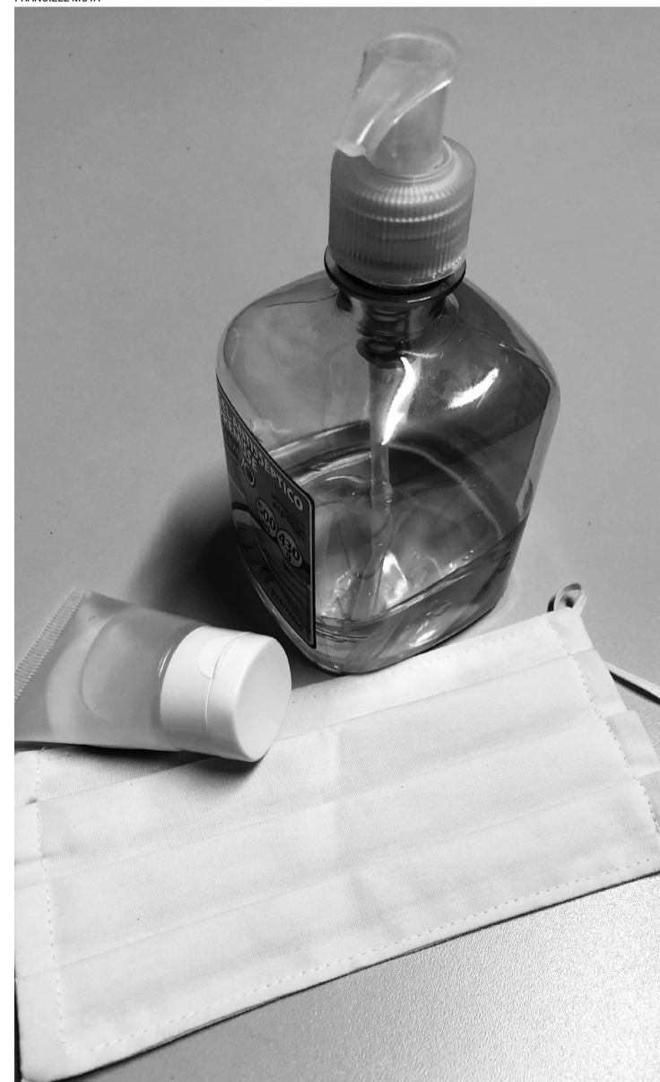
> O Conselho enfatiza o cuidado individual

mas é preciso persistir nos cuidados individuais porque mesmo que haja uma redução nos casos, ainda podem ocorrer pequenos surtos. Por isso, os cuidados são essenciais", enfatiza o presidente.